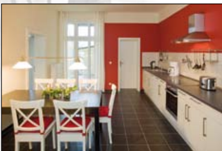
Küche in der Ferienwohnung

„Alte Reederei“ Brandenburger Straße 38/39 · 16798 Fürstenberg/Havel www.AlteReederei.de