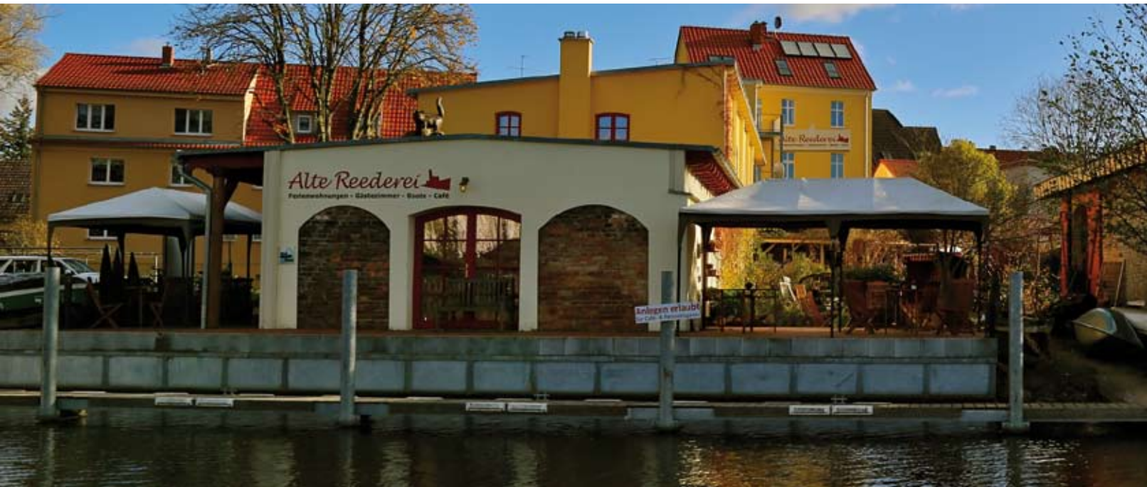
Die „Alte Reederei“ in Fürstenberg an der Havel

In kleinen Gruppen erkunden wir die Umgebung, die versteckten Ruinen und die Seen um unseren Stützpunkt herum, der „Alten Reederei“.